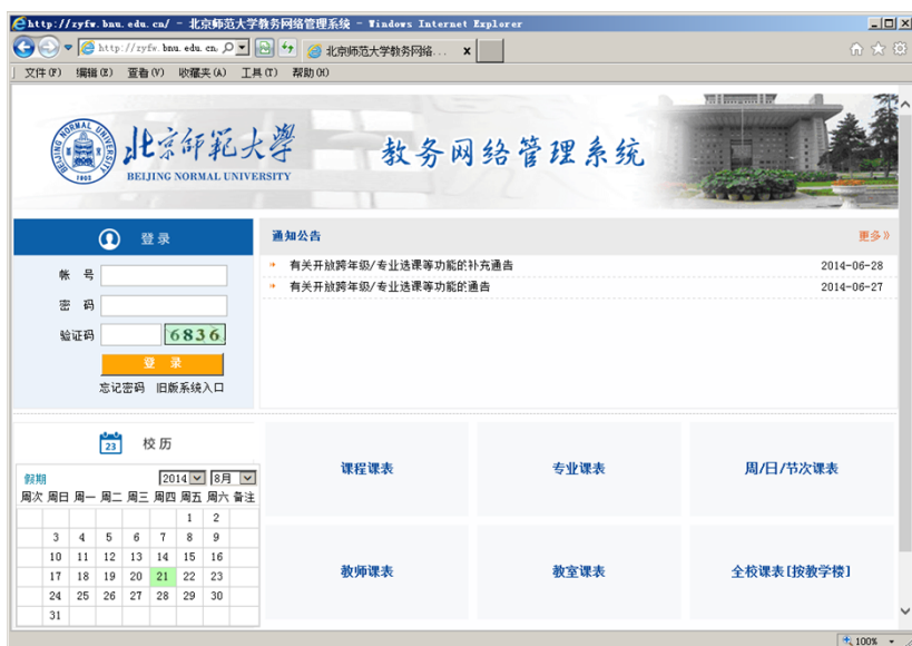
图2:教务网络管理系统登录页面

在登录界面提供了一些不需要输入用户名和密码即可浏览的公共信息,如“校历”和各种课表查询(课程课表、教师课表、教室课表、专业课表、节次课表、全校课表等)。通过这些功能,同学们可以查看当前学期的校历(完整校历可以查看学校主页→走进师大→校历),也可以通过不同的条件查看当前学期的教学安排(课表)。